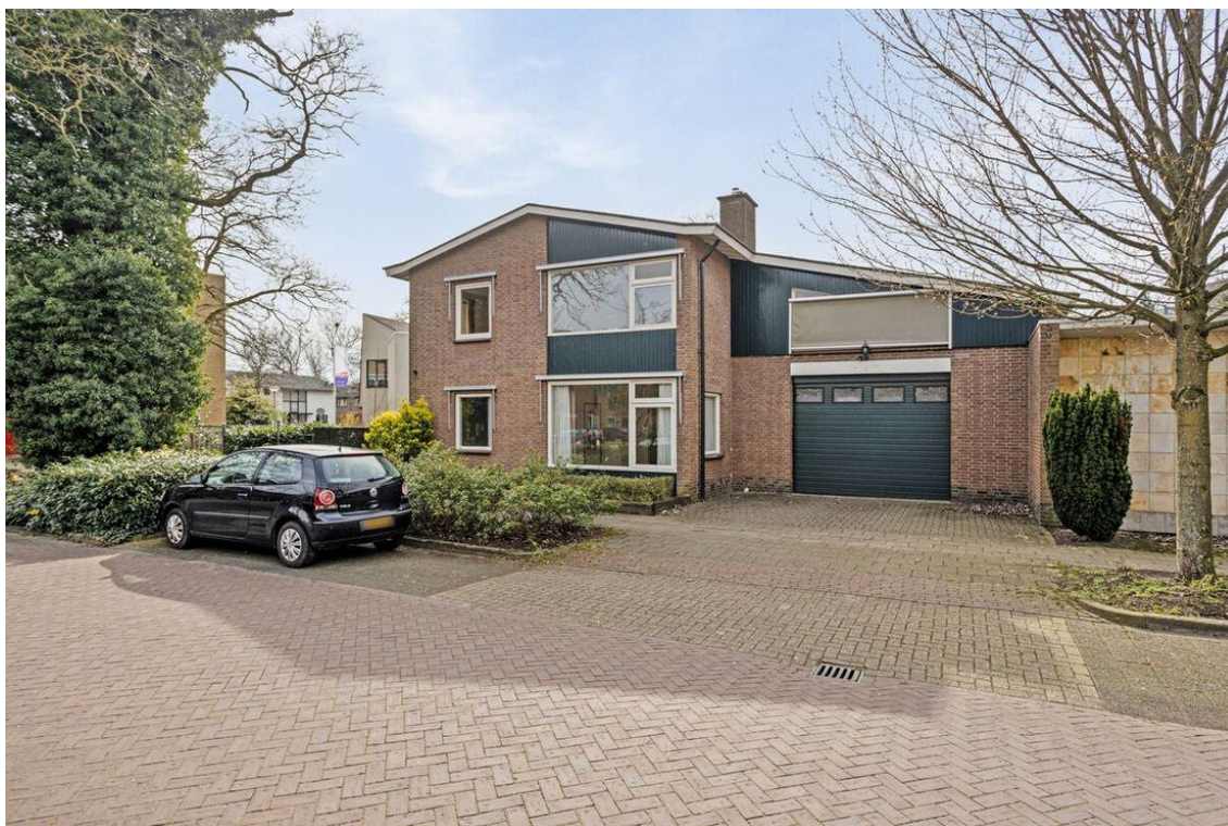
Jacob van Houtestraat 16 en 14 te Nijverdal