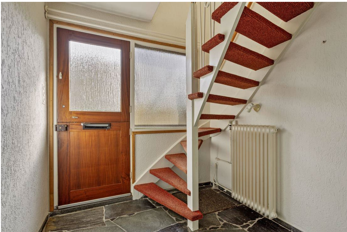
Jacob van Houtestraat 16 en 14 te Nijverdal