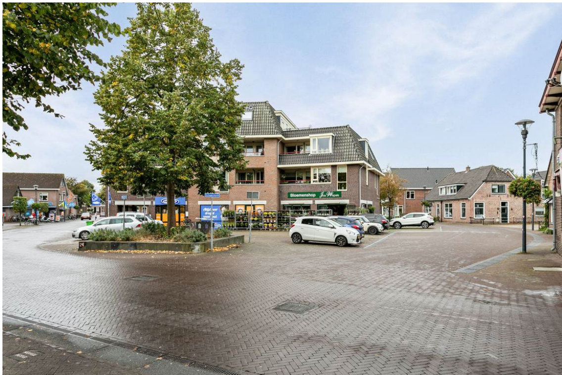
Schapenmarkt 16 te Hellendoorn