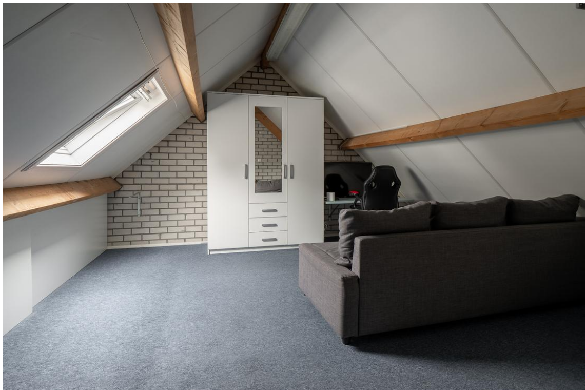
Evertskamp 5 te Haarle