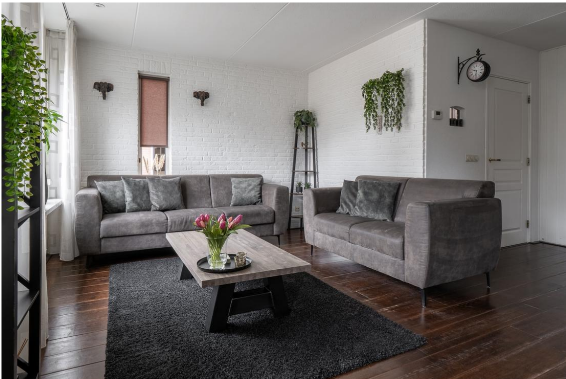
Evertskamp 5 te Haarle