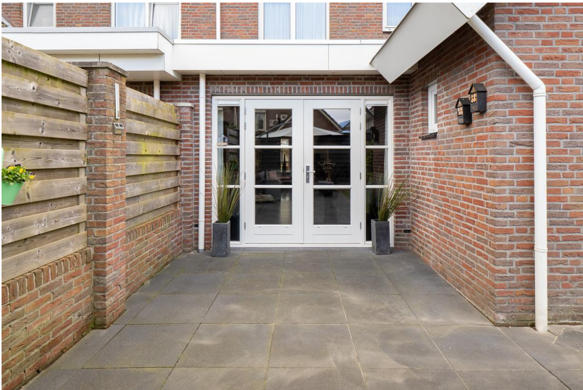
Evertskamp 5 te Haarle