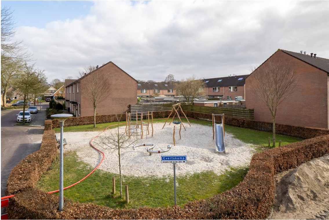
Evertskamp 5 te Haarle