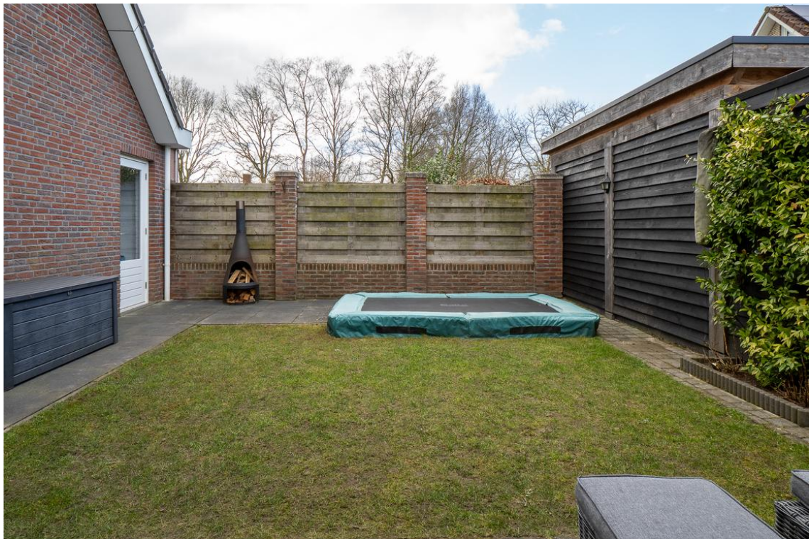
Evertskamp 5 te Haarle