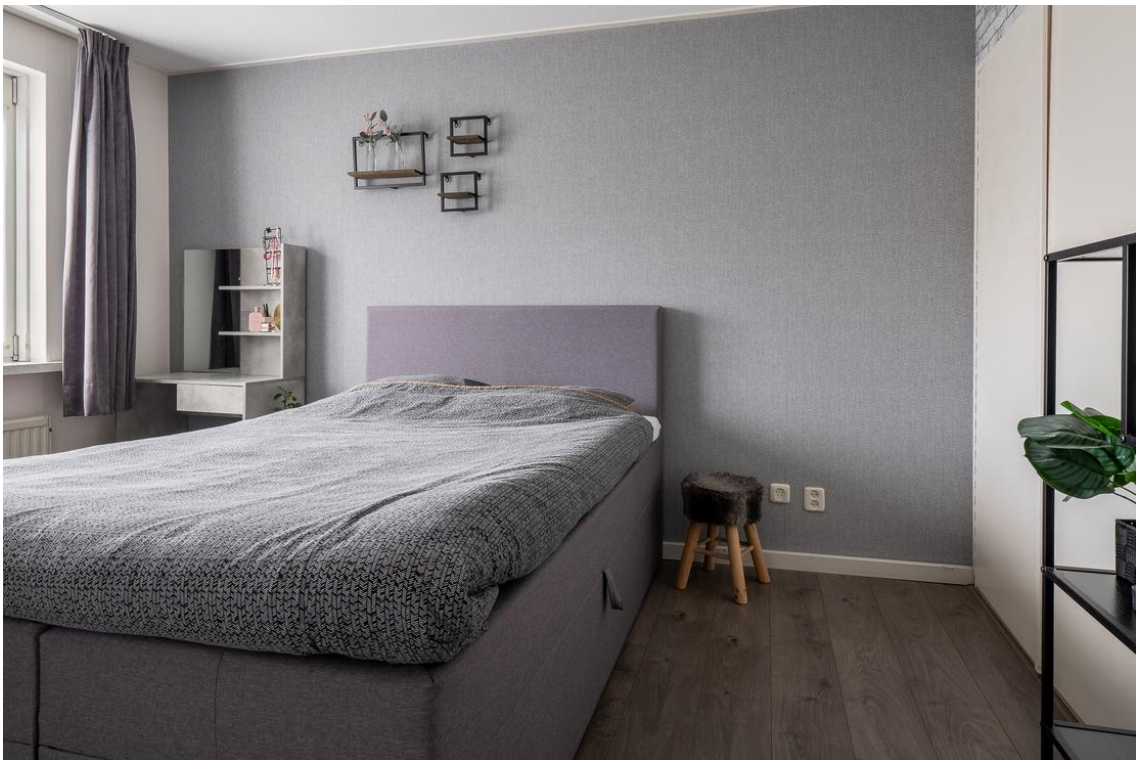
Evertskamp 5 te Haarle