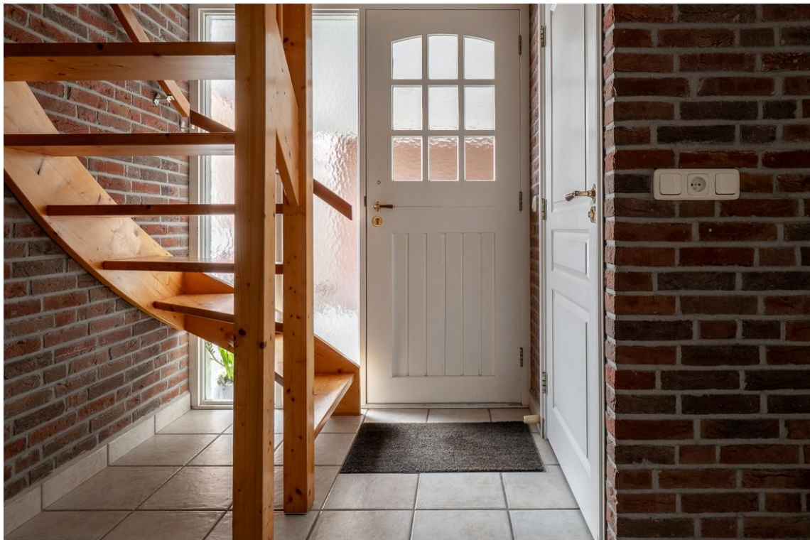
Evertskamp 5 te Haarle