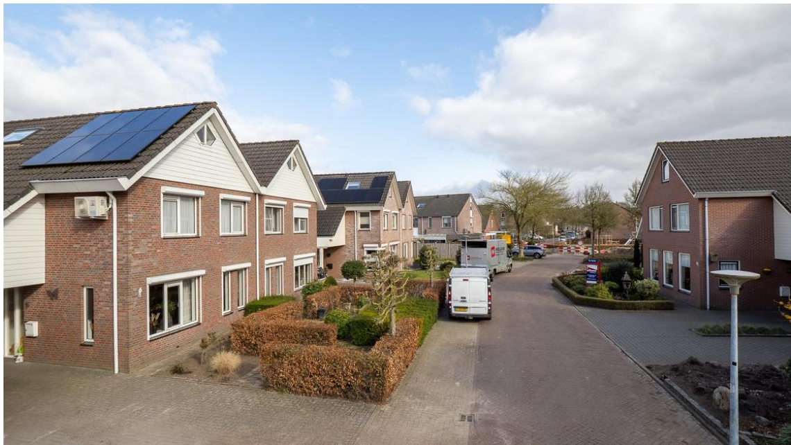
Evertskamp 5 te Haarle