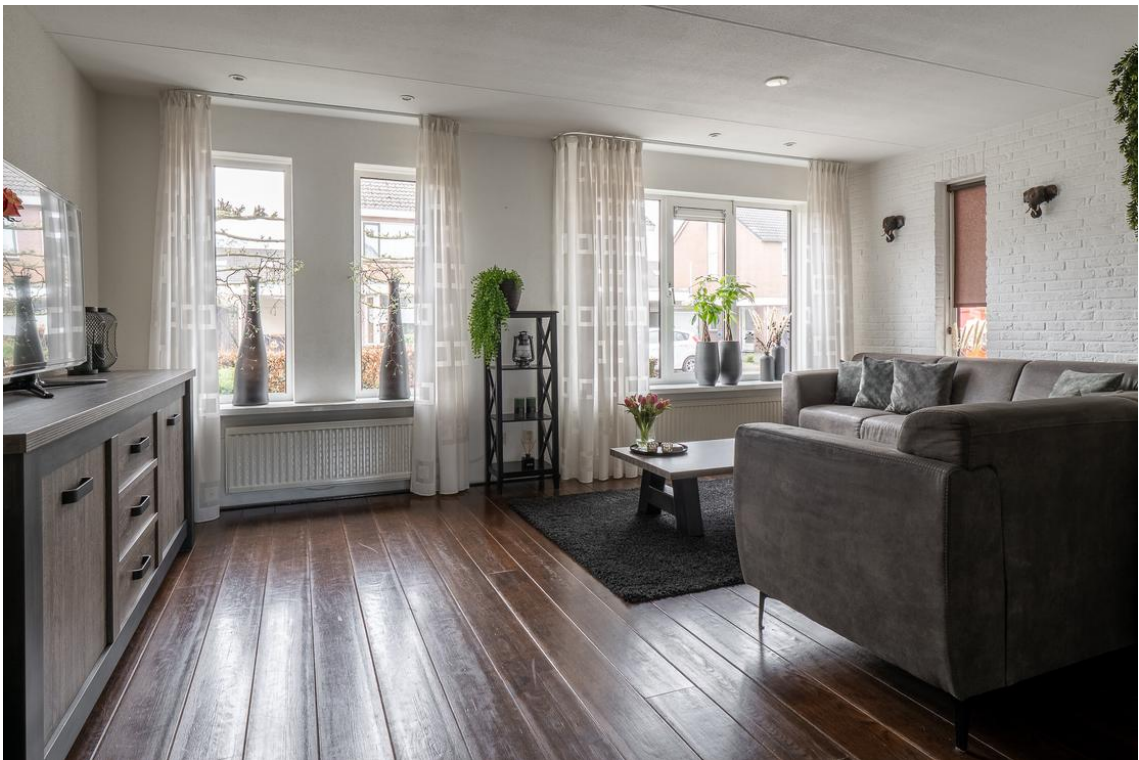
Evertskamp 5 te Haarle