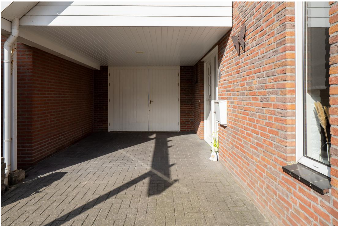
Evertskamp 5 te Haarle