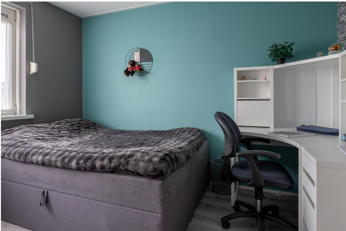
Evertskamp 5 te Haarle