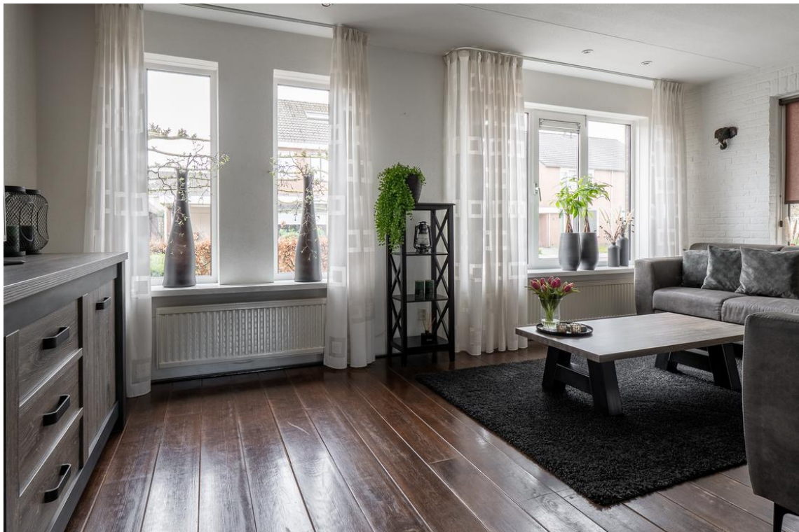
Evertskamp 5 te Haarle