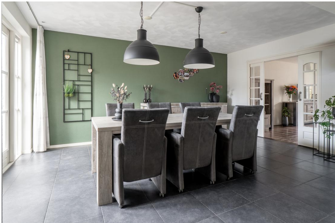
Evertskamp 5 te Haarle