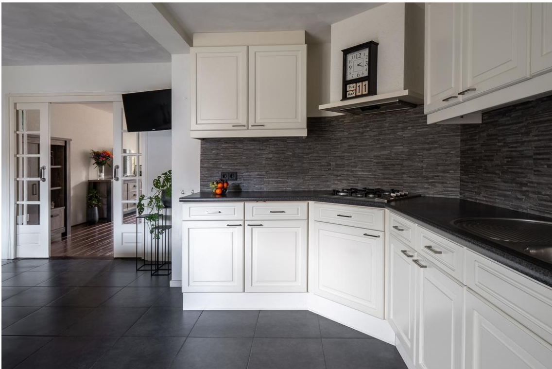
Evertskamp 5 te Haarle