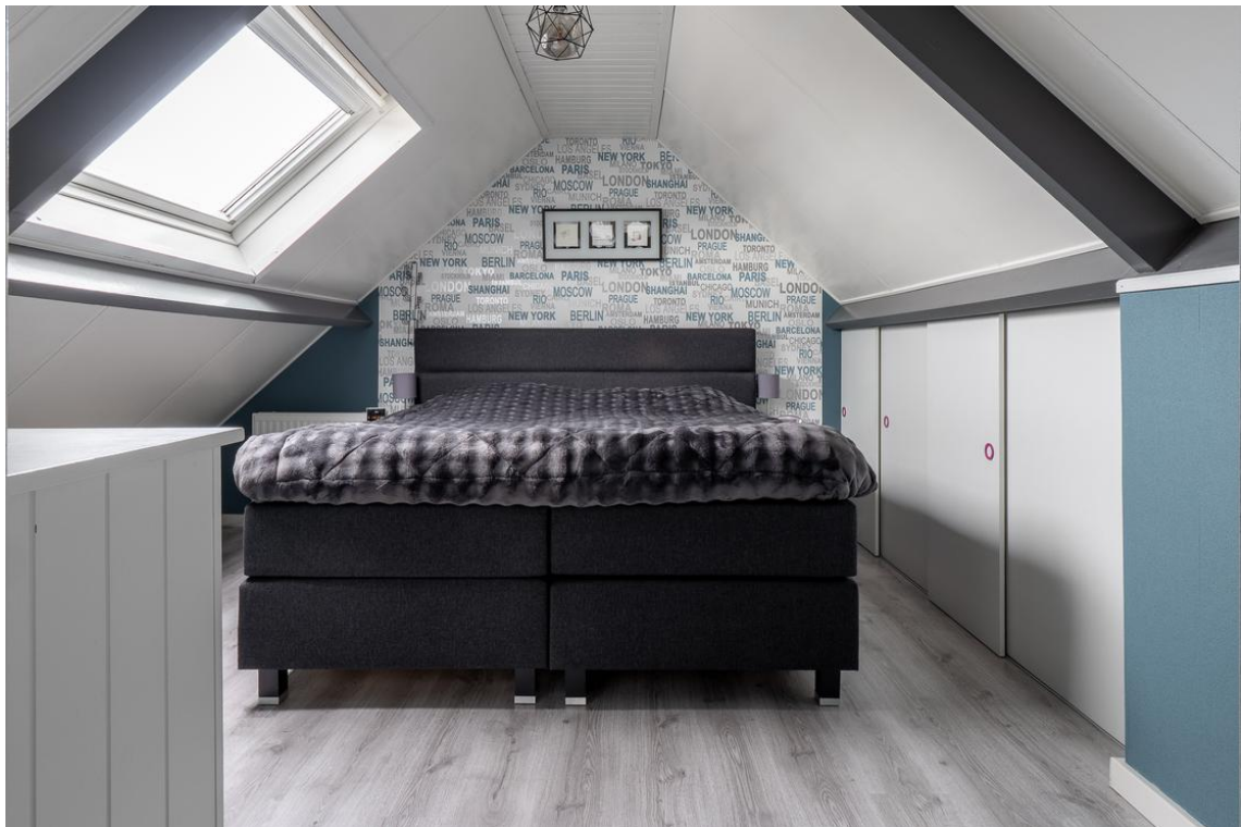
Evertskamp 5 te Haarle