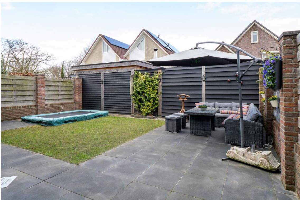
Evertskamp 5 te Haarle