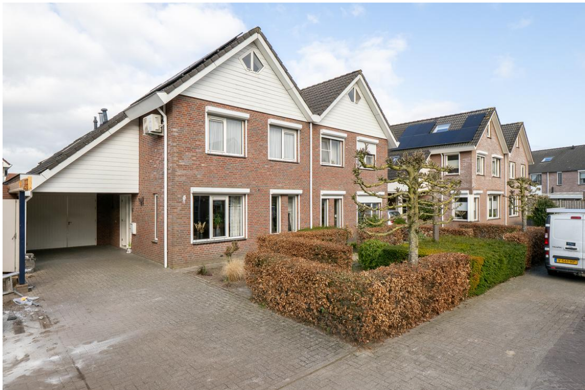
Evertskamp 5 te Haarle