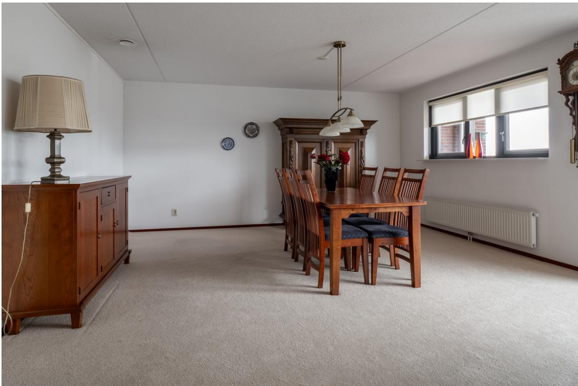
Grotestraat 128-13 te Nijverdal