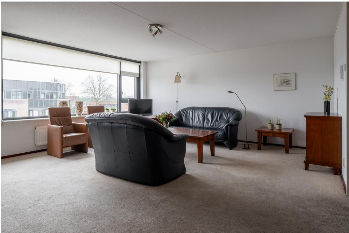
Grotestraat 128-13 te Nijverdal