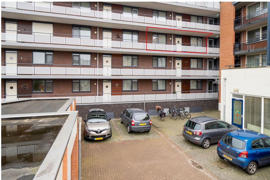
Grotestraat 128-13 te Nijverdal