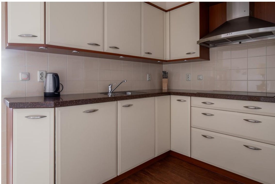
Grotestraat 128-13 te Nijverdal