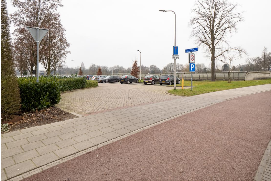
Grotestraat 128-13 te Nijverdal