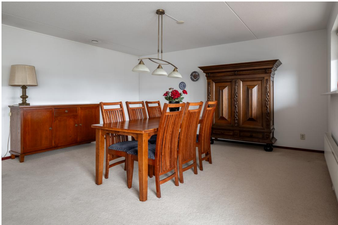
Grotestraat 128-13 te Nijverdal