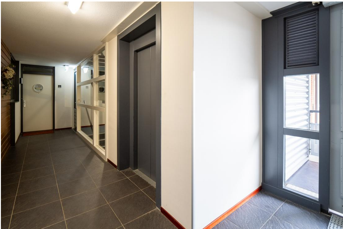
Grotestraat 128-13 te Nijverdal