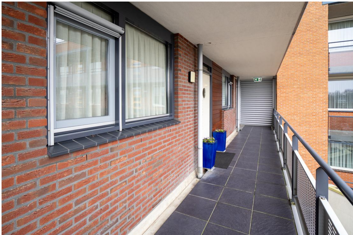
Grotestraat 128-13 te Nijverdal