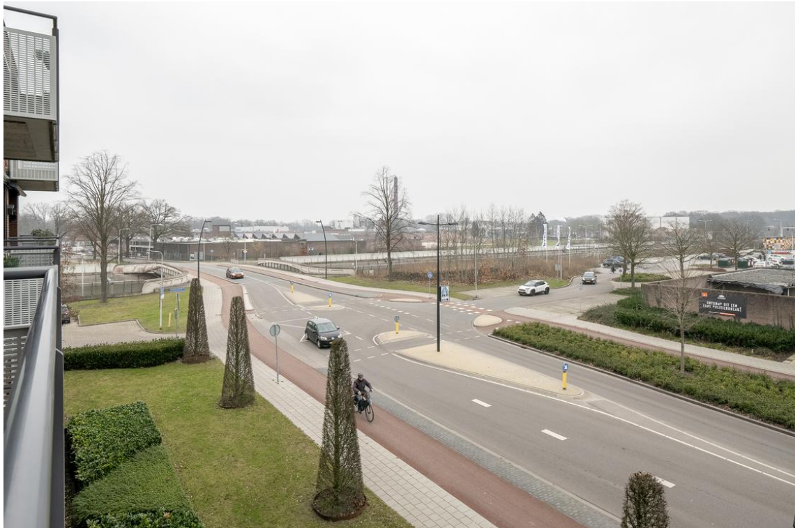
Grotestraat 128-13 te Nijverdal