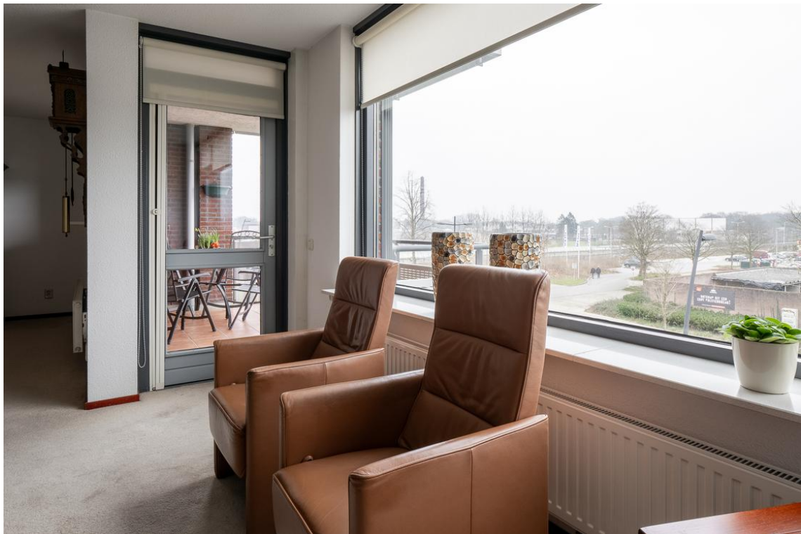
Grotestraat 128-13 te Nijverdal