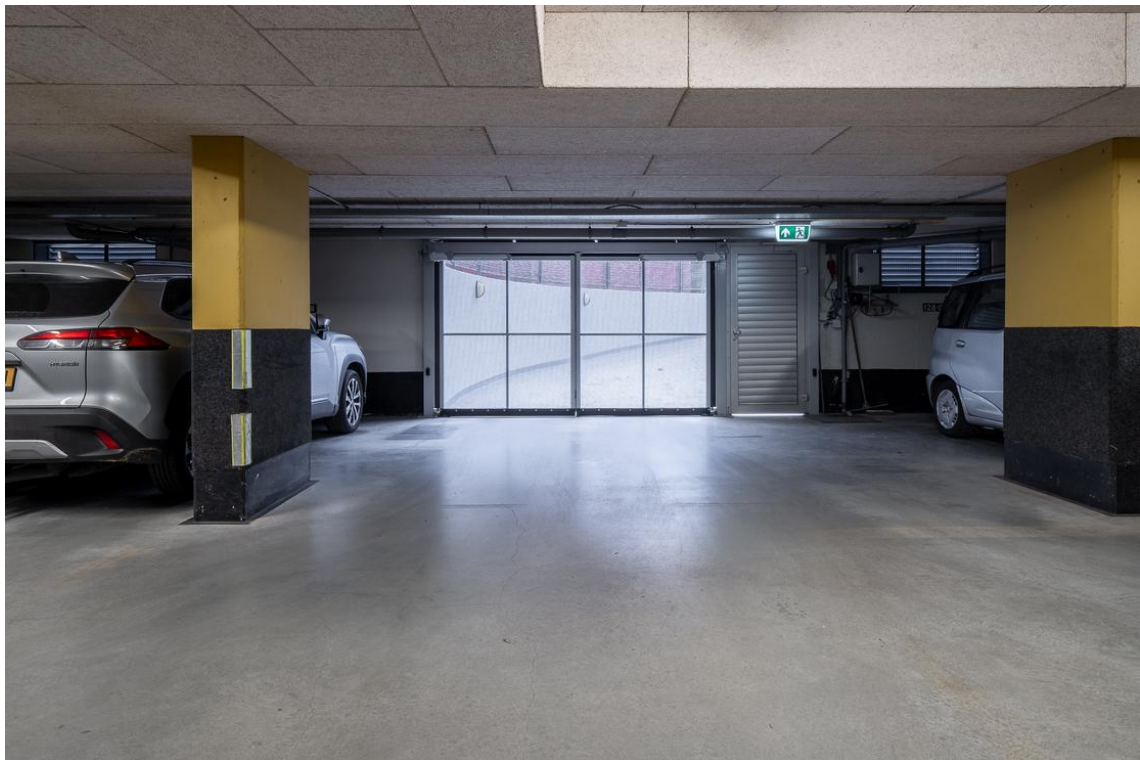
Grotestraat 128-13 te Nijverdal