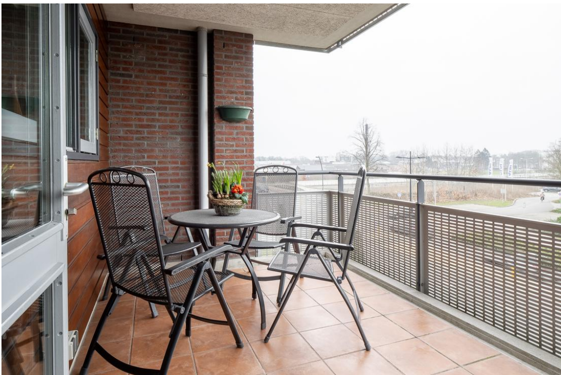
Grotestraat 128-13 te Nijverdal