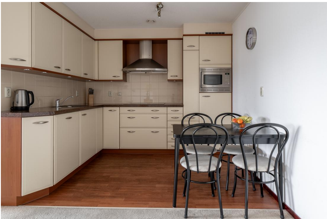
Grotestraat 128-13 te Nijverdal