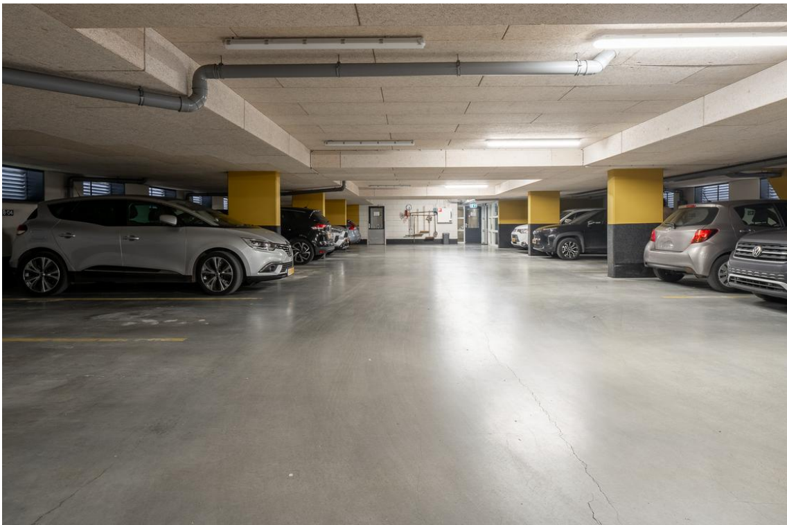
Grotestraat 128-13 te Nijverdal