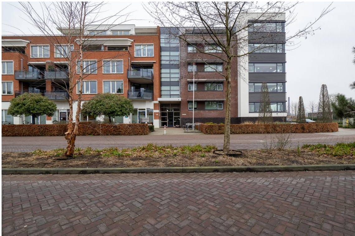
Grotestraat 128-13 te Nijverdal