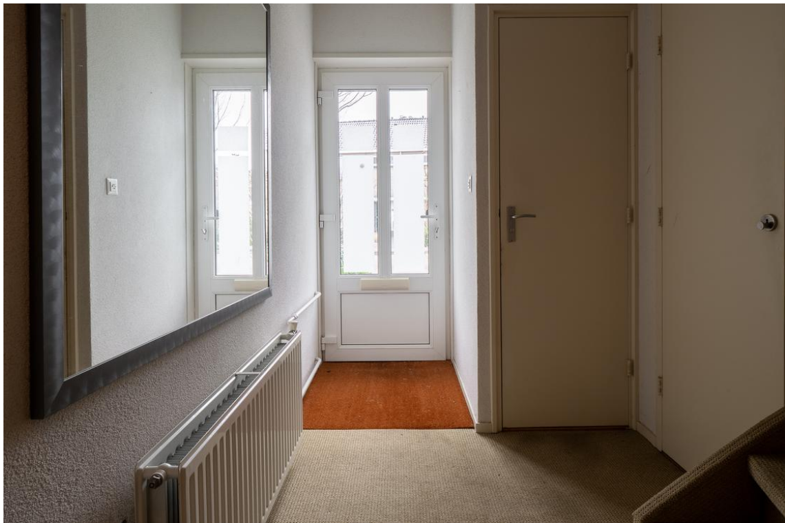
Koetshuisstraat 33 te Hellendoorn