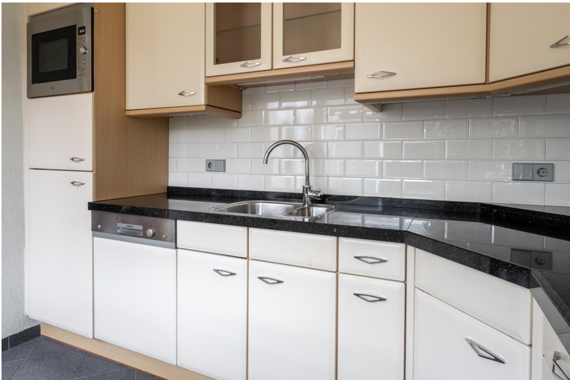
Koetshuisstraat 33 te Hellendoorn