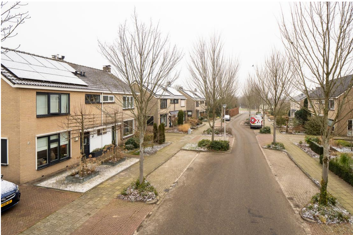
Koetshuisstraat 33 te Hellendoorn