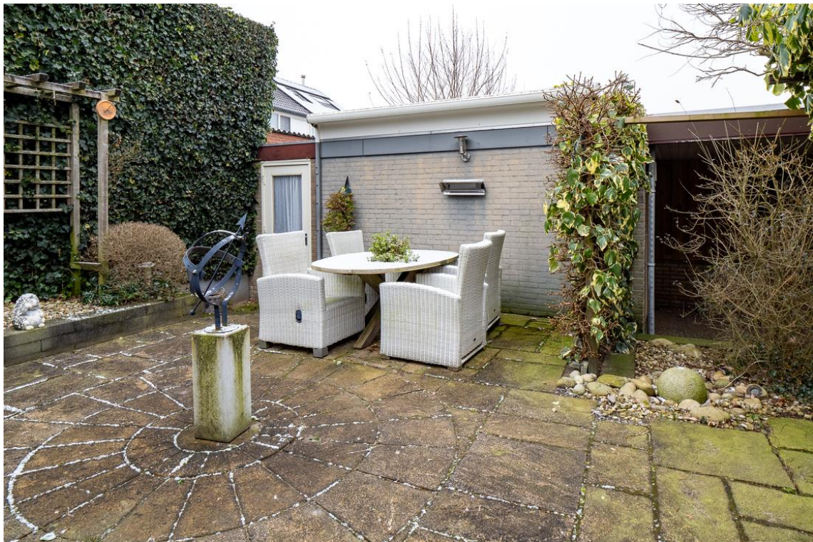
Koetshuisstraat 33 te Hellendoorn