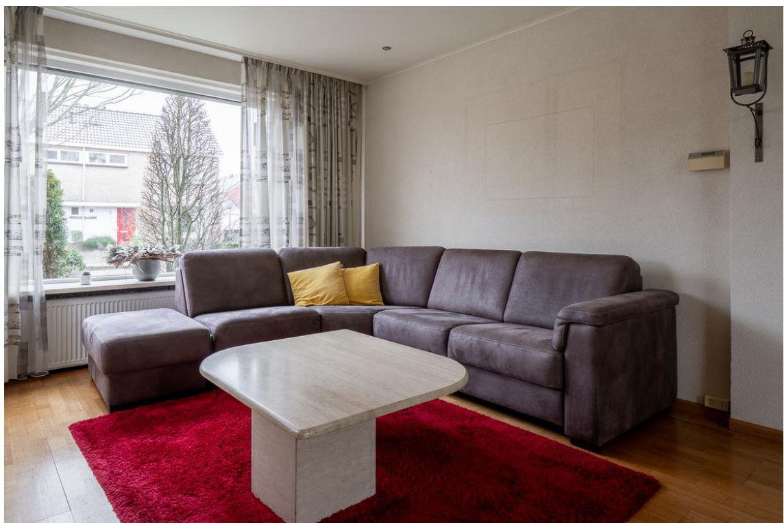
Koetshuisstraat 33 te Hellendoorn