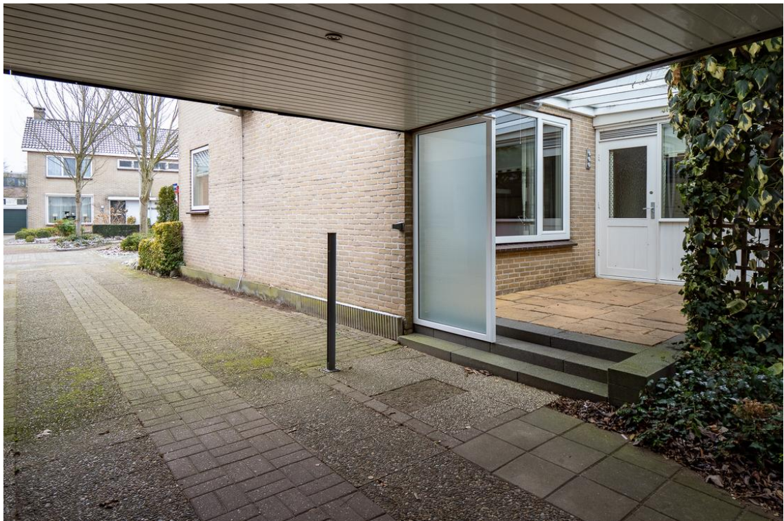
Koetshuisstraat 33 te Hellendoorn