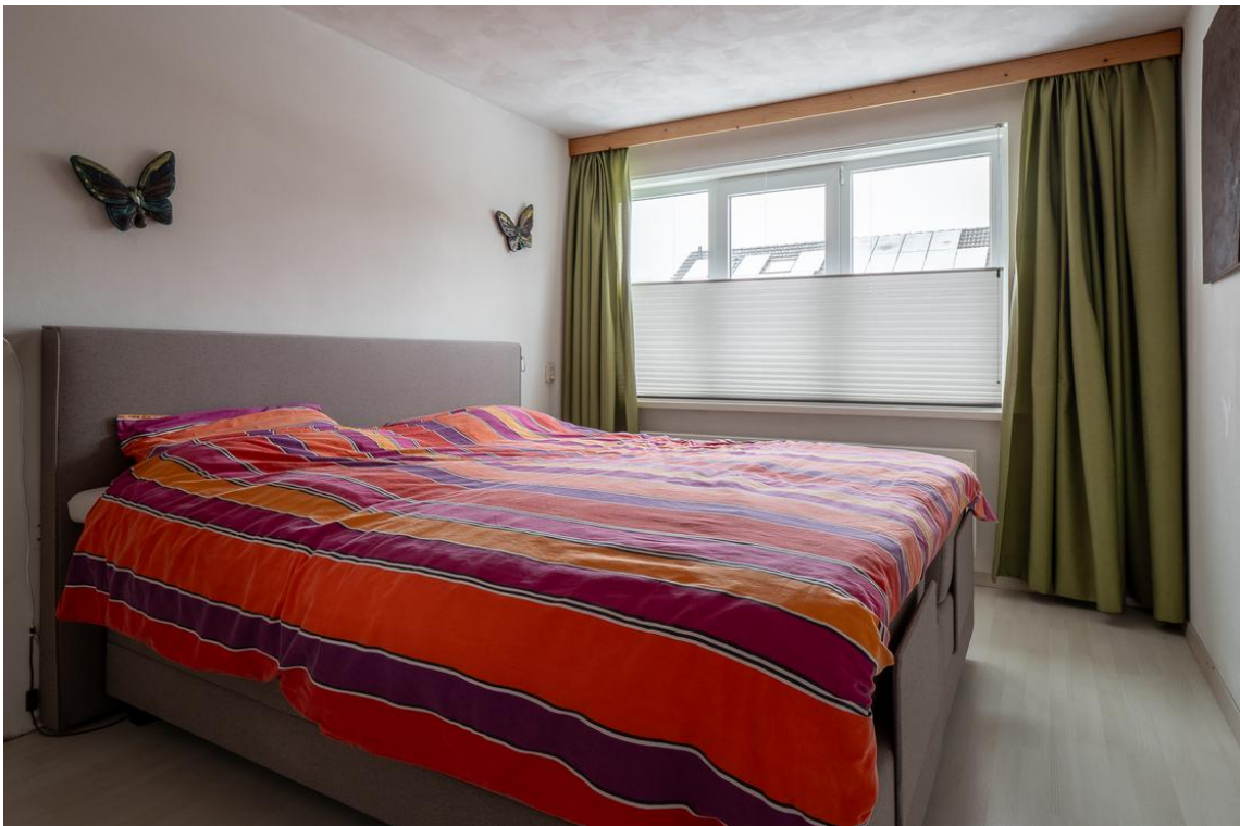
Koetshuisstraat 33 te Hellendoorn