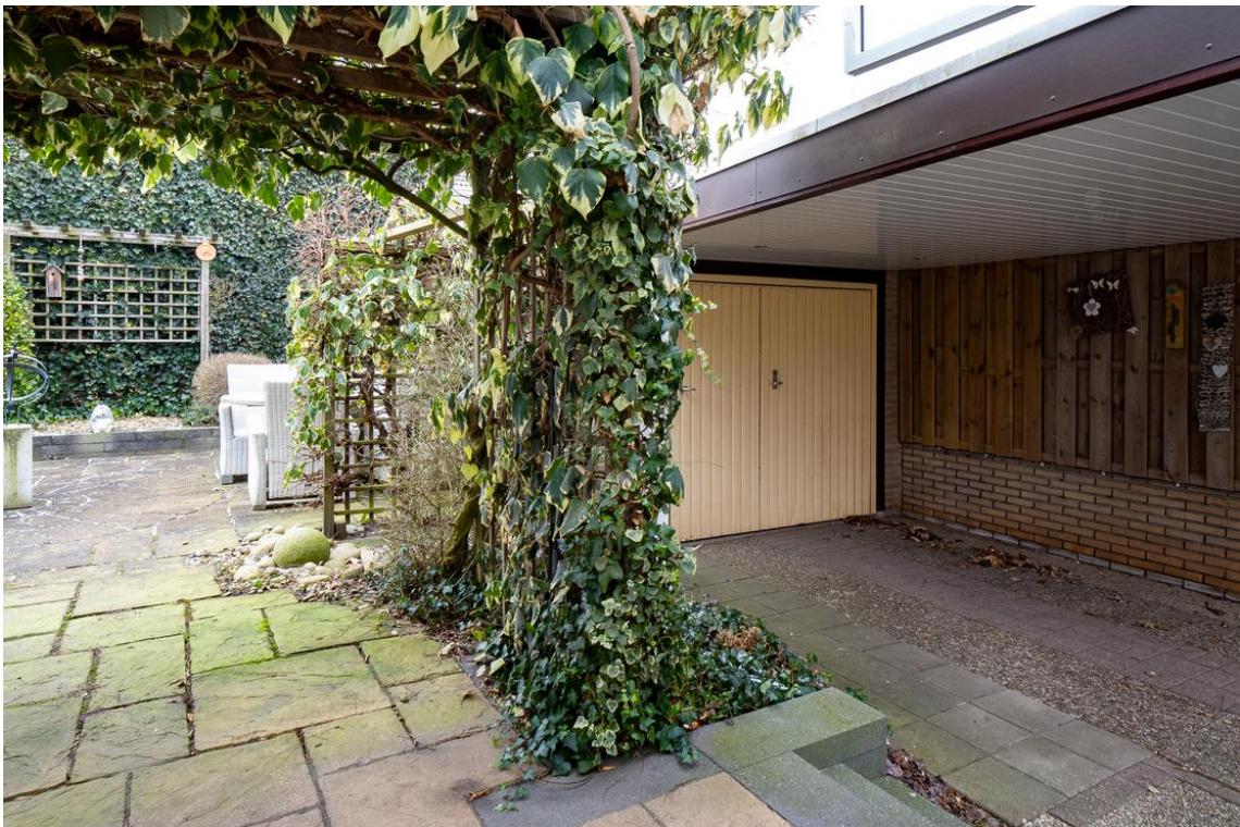
Koetshuisstraat 33 te Hellendoorn