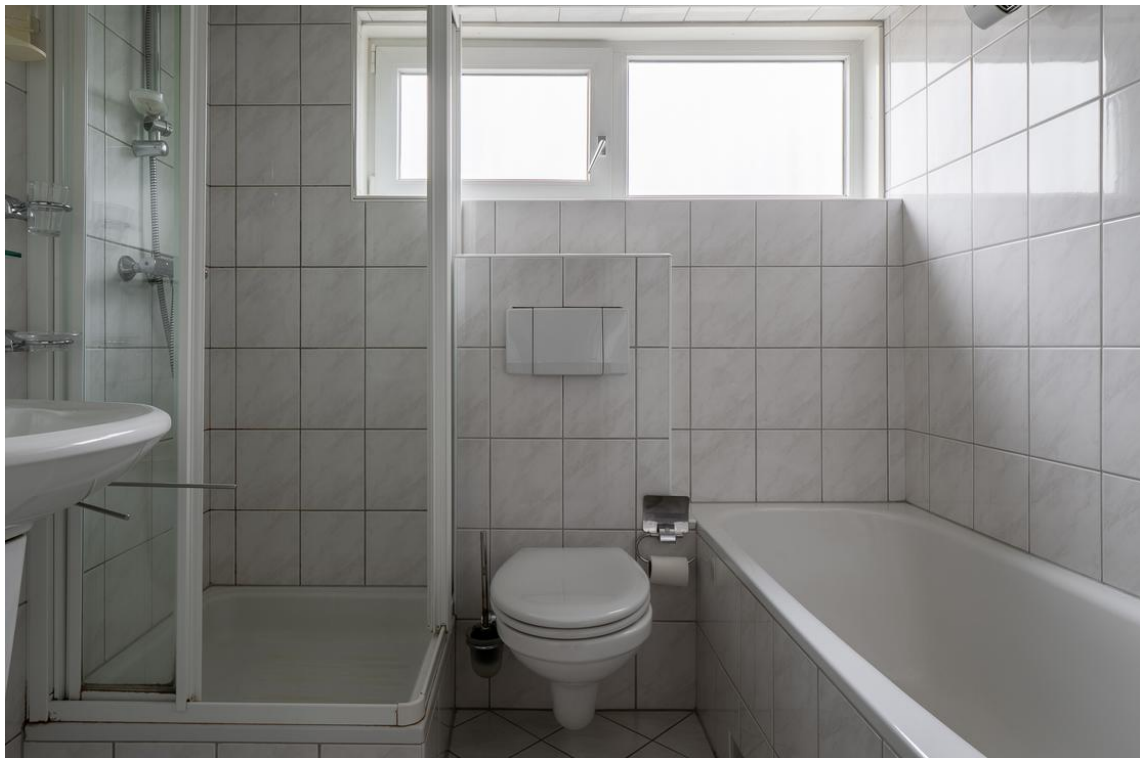
Koetshuisstraat 33 te Hellendoorn