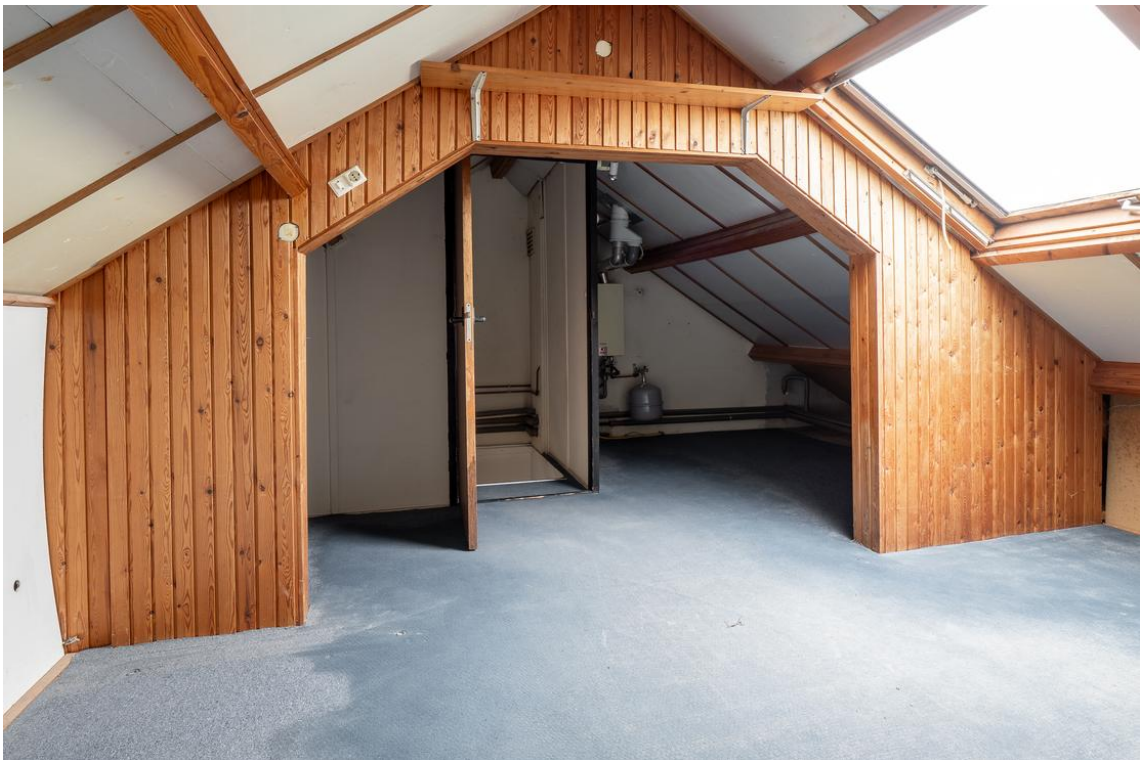
Koetshuisstraat 33 te Hellendoorn