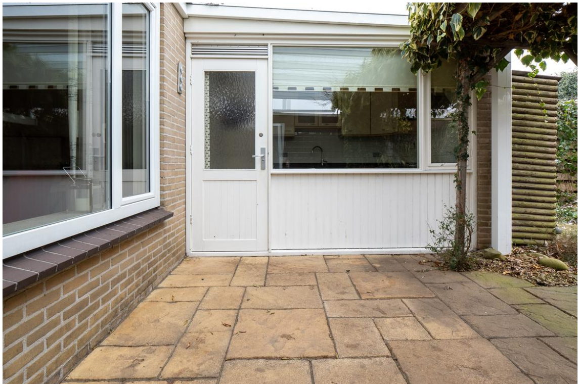
Koetshuisstraat 33 te Hellendoorn