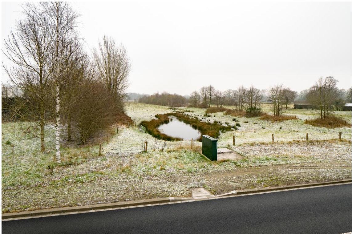
Koetshuisstraat 33 te Hellendoorn