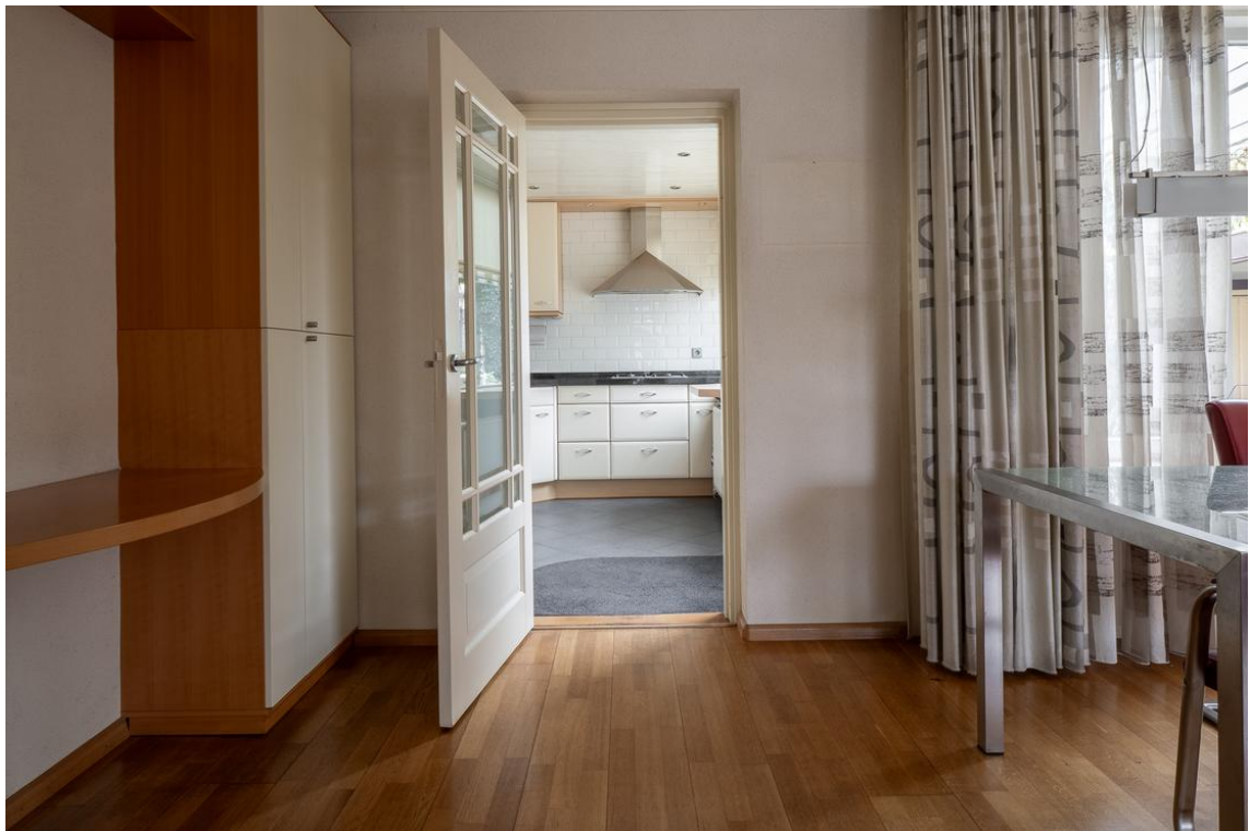
Koetshuisstraat 33 te Hellendoorn