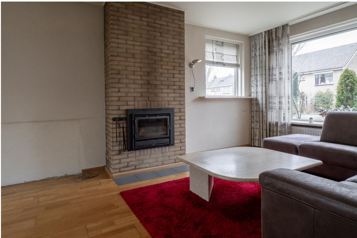
Koetshuisstraat 33 te Hellendoorn