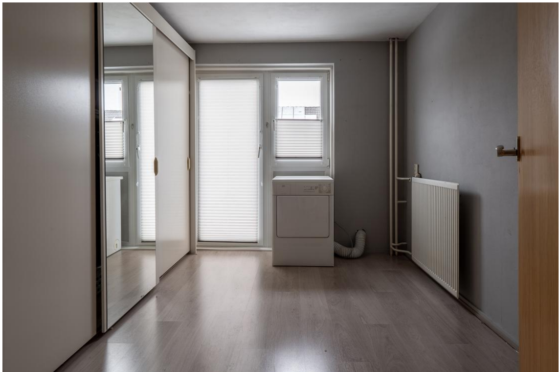
Koetshuisstraat 33 te Hellendoorn